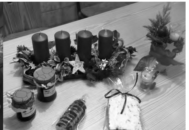
Eindrücke vom Weihnachtsmarkt im MarktTreff